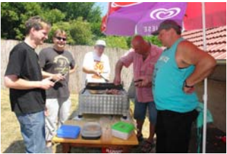
Grillen ist bei diesen Temperaturen Männerarbeit.