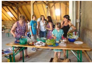
In der Scheune war es angenehm kühl.